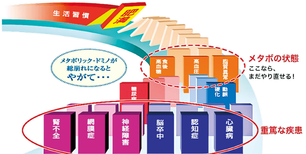
慶応義塾大学医学部教授 伊藤裕先生の図を改変