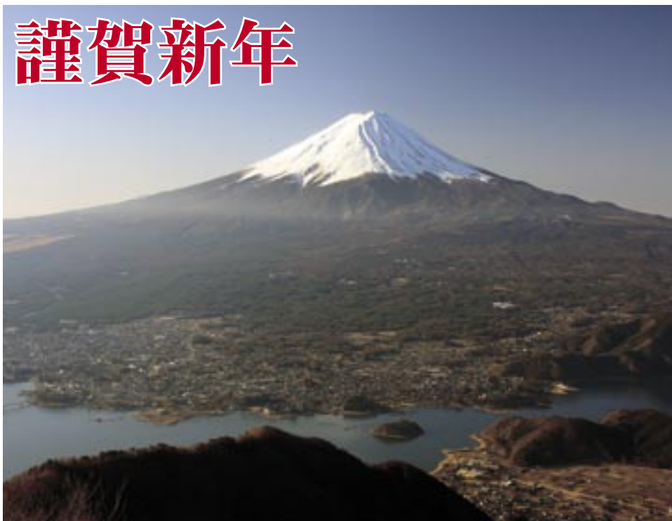
世界遺産・霊峰富士と河口湖