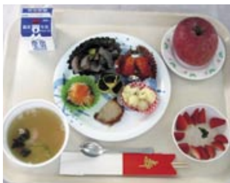
《糖尿食昼食会 献立表》

600kcal (7.5単位) 塩分 3.3 g (調味料 2.6 g + 食品中 0.7 g) (390 kcal (4.9単位) + 間食 210kcal (2.6単位))